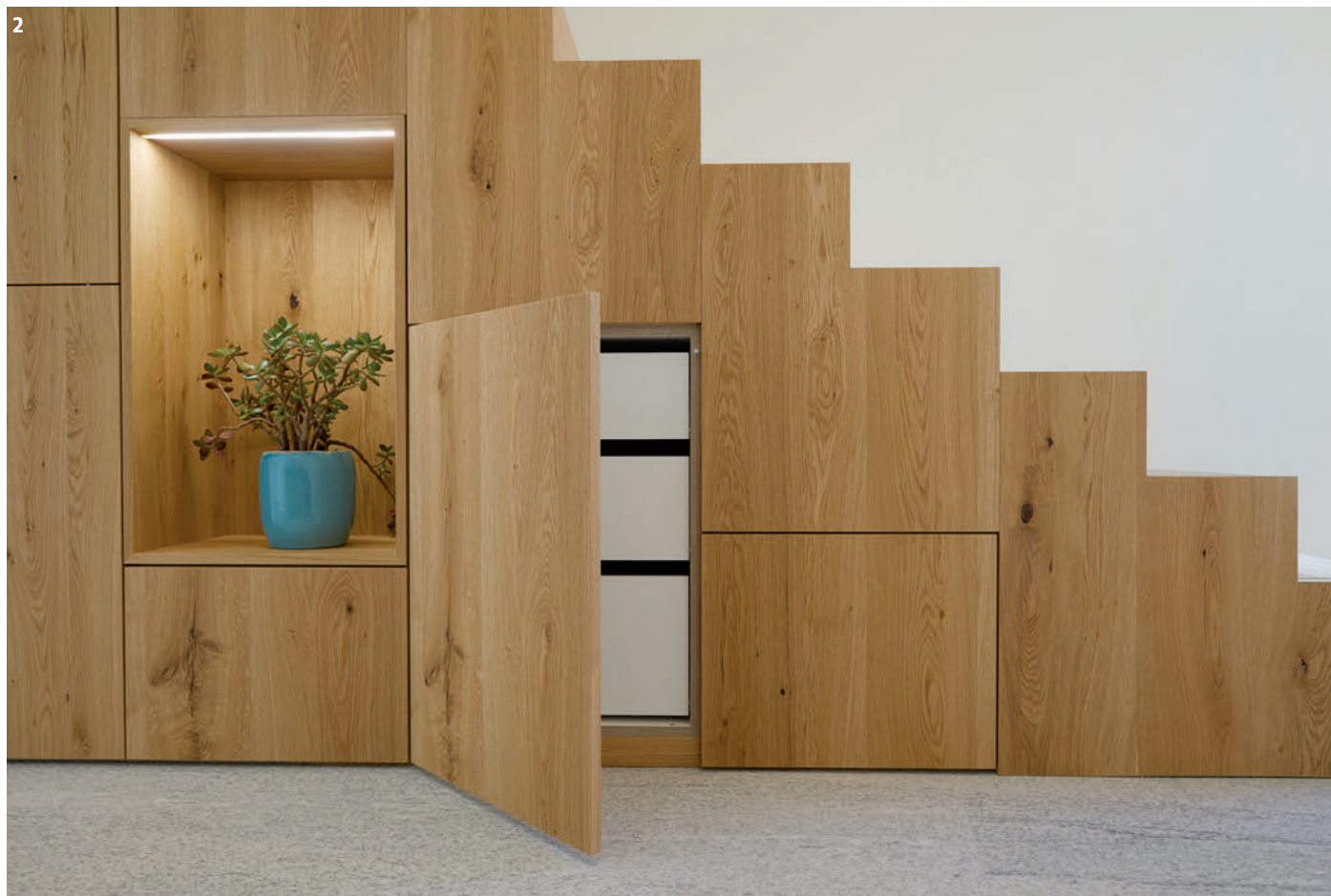
2 Der Raum unter der Treppe wurde zum Stauraum ausgebaut.