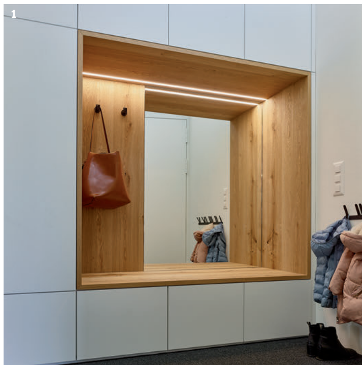
1 Garderobenschrank mit Sitznische, LED-Beleuchtung und Haken.

Hier wohnt ein Architektenpaar: Schon auf den ersten Blick vermitteln die Räume ein gutes Gefühl. Was macht es aus, dass alles so harmonisch wirkt? Ein Referenzprojekt der HLP Architekten in Zusammenarbeit mit Alpnach Norm. Von Christoph Rogger (Text)